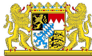
Representação do Estado da Baviera no Brasil Repräsentanz des Freistaates Bayern in Brasilien